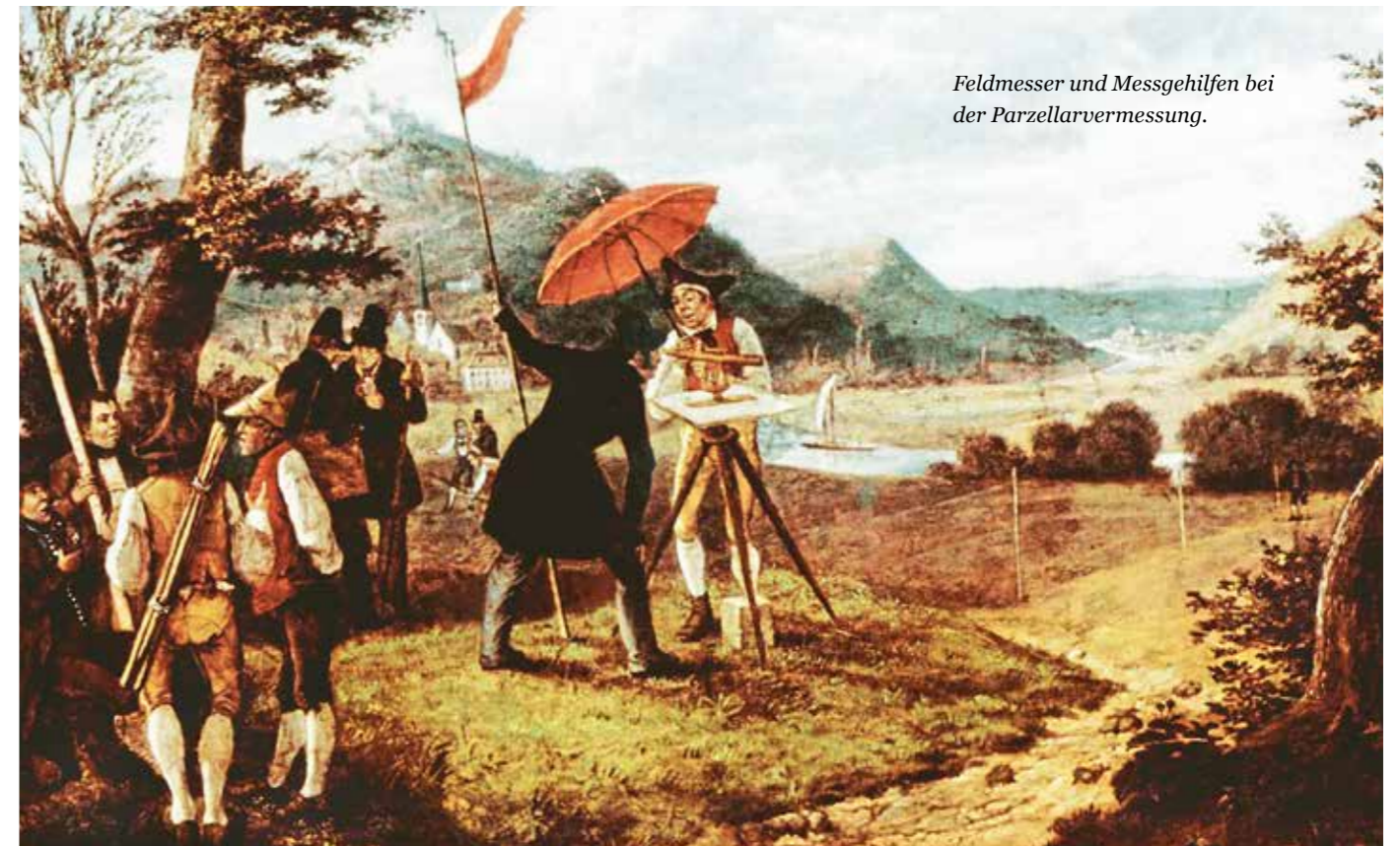
Feldmesser und Messgehilfen bei der Parzellarvermessung.

Das „Bureau der Primärkataster“ war für die Aufstellung der gemarkungswisen Primärkataster zuständig. Das Primärkataster führte in Buchform tabellarisch alle Gebäude, die bebauten Parzellen, Feldgüter, Wege und Gewässer auf. Die Beschreibungen der Parzellen beinhaltete eindeutige Nummern und Angaben zu Nutzungen, Flächen und Eigentümern. Wurden bei der Vermessung die Parzellen noch bezogen auf ein Messtischblatt (Flurkarte) nummeriert, erfolgte bei der Aufstellung der Primärkataster die gemarkungswise Zusammenführung aller Flurstücke und eine durchgehende neue Nummerierung. Den Abschluss der Arbeiten bildete die Publikation des Katasters durch einen