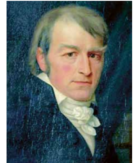
Er hatte ab 1818 die wissenschaftliche Leitung der Katasterkommission: Professor Johann Gottlieb Friedrich von Bohnenberger (1765 - 1831).

Die Wahl des Maßstabes für die quadratischen Flurkarten fiel auf 1:2.500. Damit erhielt man eine überschaubare Anzahl an Karten und konnte auch noch kleinere Flurstücke ausreichend darstellen. Auch erschien es als idealer Maßstab für das Steuerkataster und für viele Bereiche der öffentlichen Verwaltung.