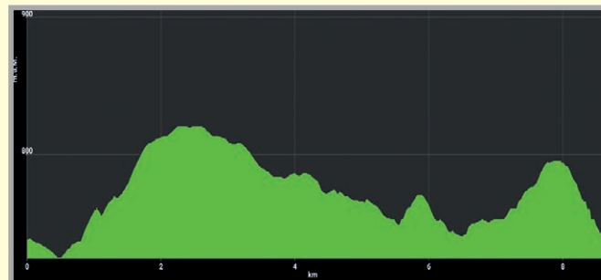
Höhenprofil eines Tracks